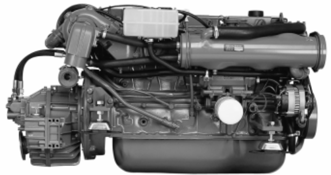
TAMD41 mit HS63A Wendegetriebe

Leiserer Lauf, größere Zuverlässigkeit und höhere Effektivität, das sind die Kennzei-